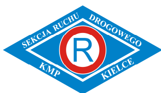
Sekcja ruchu drogowego KMP Kielce