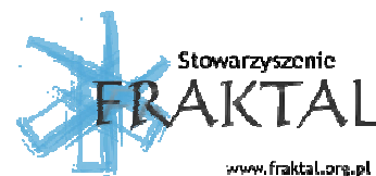
Stowarzyszenie ratownictwa FRAKTAL