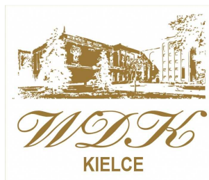
Wojewódzki Dom Kultury w Kielcach